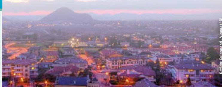
Grafiche Calligaro srl - Vigonza (PD)