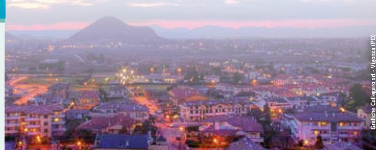
Grafiche Calligaro srl - Vigonza (PD)

Via S. Pio X, 2 - 35036 MONTEGROTTO TERME - PADOVA - ITALIA Tel. / Fax +39 049 8910591 prenotazioni@commodore.it - hotelcommodore@commodore.it www.commodore.it